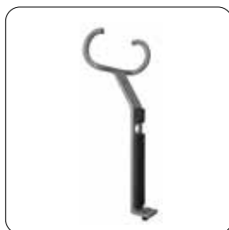
Wellenablage (shaft deposit) ▶ 700 061