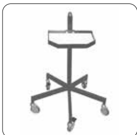
Fahrbarer Ständer (movable stand) ▶ 700 012