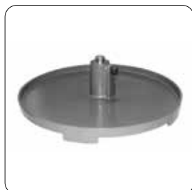
Drehteller (turning disc) ▶ 17 716 010-1