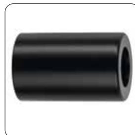
Antriebsschutz (Drive protection) ▶ 480 471