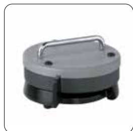
Fußanlasser (Topf) (round) ▶ 700 064