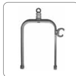
Hängebügel mit Zapfen (shackle suspension with pin) ▶ 700 062