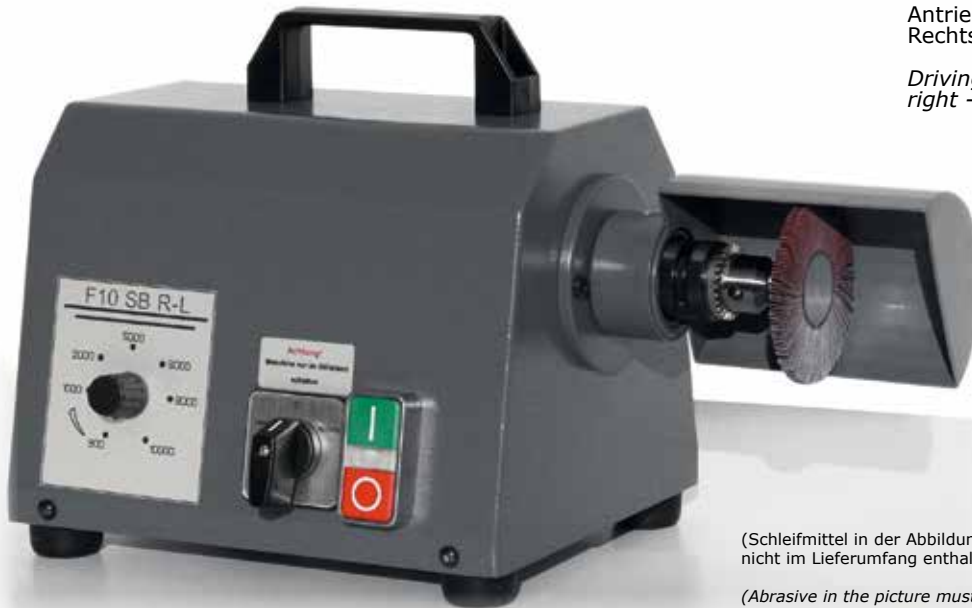
Antriebsmaschine F10 SB R-L Bohrfutter, Rechts- Linkslauf