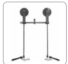
Hängebügel mit Rollen (shackle suspension with rolls) ▶ 17 815 127