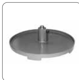
Drehteller (turnable disc) ▶ 17 815 110 (Ø 36,5mm)