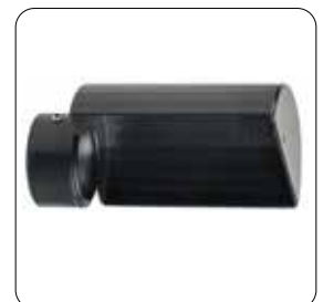
Schutzhaube (Protection cover) ▶ AR-100 2319